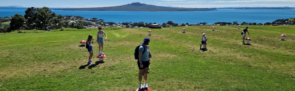
Sopka Takarunga s výhledem na ostrov Rangitoto