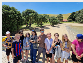
Plavba za delfíny, Bay of Islands