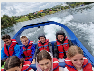
Jet boating, Taupo